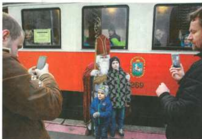
V TRAMVAJI s Mikulášem a čertem, ale také na zastávkách, kam tato tramvaj dorazila, vládla v sobotu dopoledne pohodlová atmosféra. FOTOGALERIE na www.msdenik.cz

Adámek měl nakonec štěstí. Básničku ani písničku nemusel Mikuláš ani čertovi předvést a malý dáreček si stejně odnesl – a s